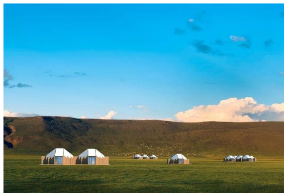
Рис.1-2. Des Ger -Geometric Mongolian Yurt. Ger Atelier