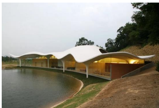
Рис. 4. Крематорий «Лес для размышлений»

Тойо Ито считал, что архитектура как бы облекает человека, подстраивается под его эмоции и культуру и связывает те или иные элементы проектируемых архитектурных пространств с общей идеей места, вырабатывая некий единый образ, поддерживающий философию пространства.