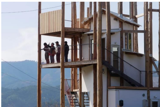
Рис. 3. «Дом-для-всех», г. Рикудзэнтаката, 2012

В марте 2011 года на востоке от Японии произошло сильнейшее землетрясение магнитудой 9 баллов, которое вызвало цунами. В результате было полностью разрушено около 120 тысяч домов, повреждено около миллиона. Эта катастрофа побудила многих японских архитекторов к разработке проектов быстровозводимого жилья общественных центров, где могли бы укрыться пострадавшие после землетрясения и цунами. Тойо Ито одним из первых откликнулся на трагедию людей, разработав «Дом-для-всех» - место, где лишившиеся своих жилищ люди могли бы пообщаться и поддержать друг друга.