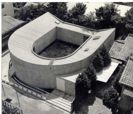
Рис. 1. White House U, 1976