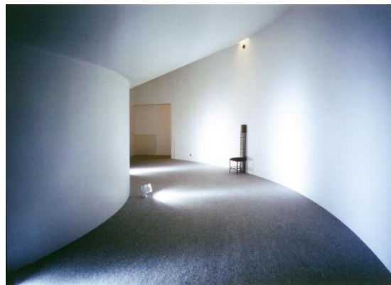
Рис. 2. Игра света и тени в интерьере дома